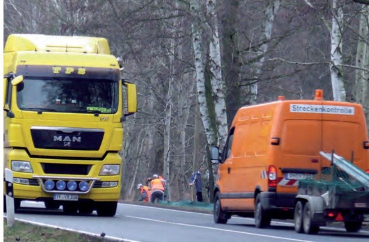
Jeden Tag kommen zahllose Tiere unter die Räder.