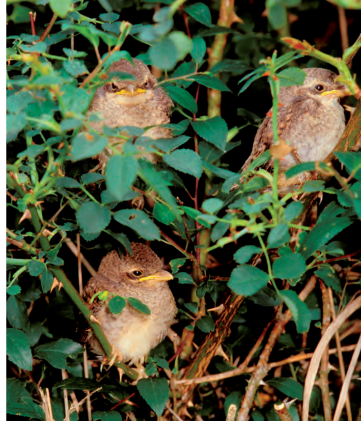
Wenn das Nest aus allen Nähten platzt, füttern die Eltern ihren Nachwuchs auch außerhalb.

schen dem kleinen Federball allerdings zu nahe kommen, dann wagen sich die Eltern nicht an den Nachwuchs heran. Falls nötig, einfach die Katze zwei Tage im Haus lassen. Sitzen Jungvögel an Straßenrändern oder ähnlichen Gefahrenorten, dann 10 bis 15 Meter forttragen und auf einen sicheren Ast setzen.