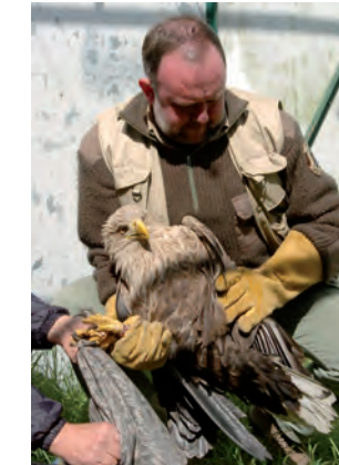
Ein Ranger hilft beherzt einem verletzten Seeadler.

Vorsicht vor kräftigen Krallen und starken Schnäbeln.