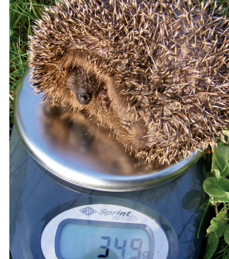
Ob das über den Winter reichen wird?

Sollten Sie einem verletzten großen Vogel begegnen, dann informieren Sie bitte unverzüglich die Unteren Naturschutzbehörden, die in jedem Landkreis zur Kreisverwaltung gehören. In meist ehrenamtlich auf Spendenbasis betriebenen Wildtierpflegestationen versuchen Fachleute alles, um die Vögel aufzupäppeln und auszuwildern.